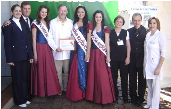
Comissão Executiva e a Corte da Expoincar com equipe da Unimed

Durante os quatro dias, passaram pelos pavilhões do parque de exposições cerca de 58 mil pessoas. A equipe da Unimed realizou 119 atendimentos e quatro remoções com ambulância UTI para o Hospital São Roque. Durante todo período do evento a Cooperativa disponibilizou plantão médico no ambulatório especialmente montado para os dias da feira, totalizando 53 horas de atendimen-