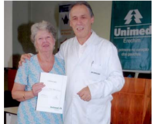
Participante recebendo seu certificado pela assiduidade