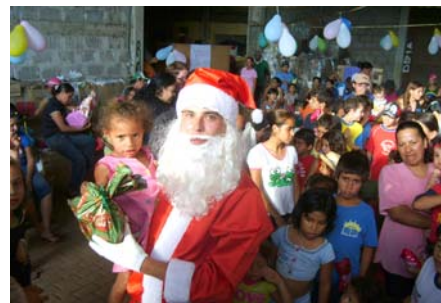
Crianças e famílias da Arcan ganharam uma festa de Natal inesquecível

das à gestão da responsabilidade social, visando o desenvolvimento sustentável da sociedade e o respeito à diversidade através de ações que reduzam as desigualdades sociais, proporcionando um final de ano melhor para as pessoas que participam da Arcan e suas famílias.