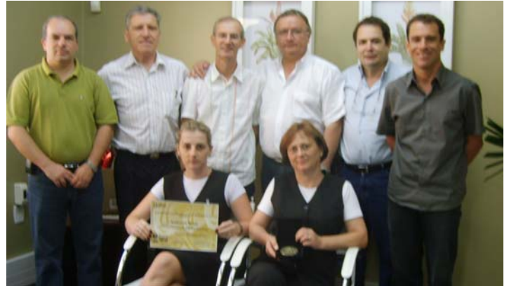
Diretoria da Unimed Erechim, Gerente e Contadora com o Certificado e a Medalha outorgados pela AL do RS